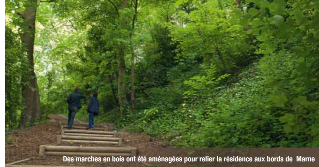
Des marches en bois ont été aménagées pour relier la résidence aux bords de Marne