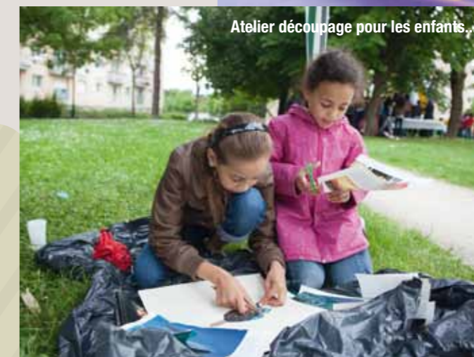
Atelier découpage pour les enfants...

« Avec mes collègues, nous avons organisé une fin d'après-midi festive. Nous avons pu compter sur l'aide de l'amicale des locataires et de l'association Les Citoyennes. La compagnie de théâtre l'Embuscade a préparé pour l'occasion une animation pour les enfants. Ces derniers ont d'ailleurs pu s'en donner à cœur joie puisque nous avons loué un grand jeu gonflable et une machine à barbe à papa... 200 barbes à papa ont été confectionnées en 3 heures de temps. On ne comptait pas les gourmands que parmi les enfants ! La fête s'est achevée avec un grand barbecue. Toutes ces festivités ont été financées grâce à l'aide du Fonds d'Initiatives Locales proposé par Valophis. »