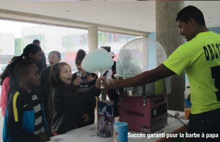
Succès garanti pour la barbe à papa