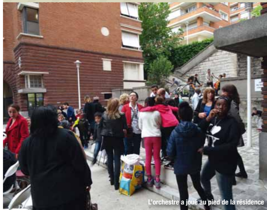
L'orchestre a joué au pied de la résidence

« Notre Amicale de locataires a été créée il y a moins d'un an. Avec la Fête des Voisins, nous voulions organiser un événement qui rassemble pour la première fois les résidents et qui nous fasse connaître d'eux. Pour les enfants, des ateliers de musique et de fabrication d'instruments à partir de matières recyclées, étaient organisés avec le concours de la Ville et de Valophis. Un orchestre a même joué une partie de la soirée. Ça a plu aux habitants. Ils en redemandent. »