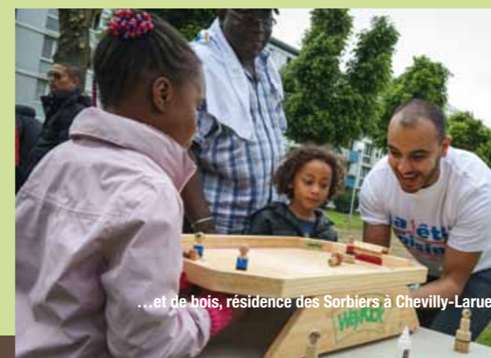
...et de bois, résidence des Sorbiers à Chevilly-Larue