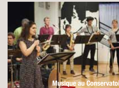
Musique au Conservatoire