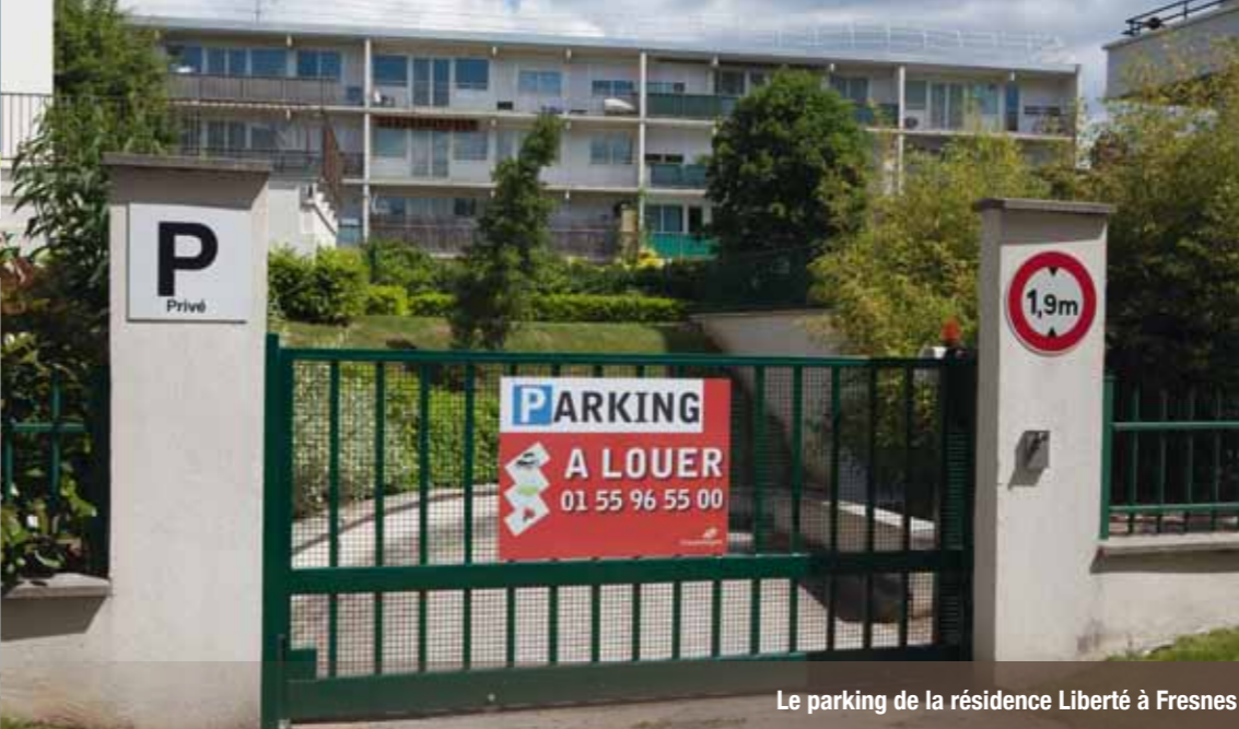
Le parking de la résidence Liberté à Fresnes