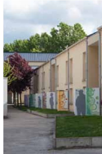
Les jeunes artistes qui ont rénové les murets

Situés en extérieur, la vingtaine de murets a donné beaucoup de travail aux jeunes. Il a fallu gratter, poncer, nettoyer, s'adapter aux intempéries. Les travaux ont avancé par étapes. Côté artistique, les jeunes ont opté pour deux techniques. Une première étape consistait à projeter leurs silhouettes sur les murs pour en dessiner les contours. La seconde étape en un travail plus graphique et abstrait.