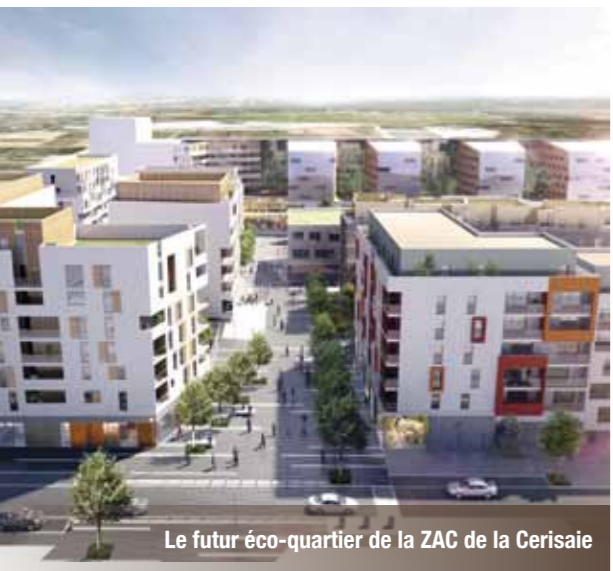
Le futur éco-quartier de la ZAC de la Cerisaie