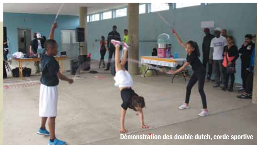
Démonstration des double dutch, corde sportive

* il s'agit de saut à la corde sportive.