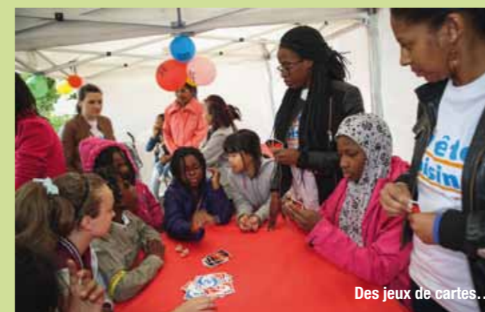
Des jeux de cartes...