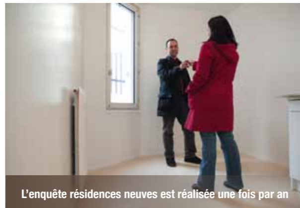
L'enquête résidences neuves est réalisée une fois par an