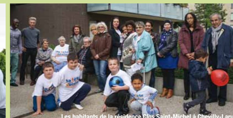
Les habitants de la résidence Clos Saint-Michel à Chevilly-Larue