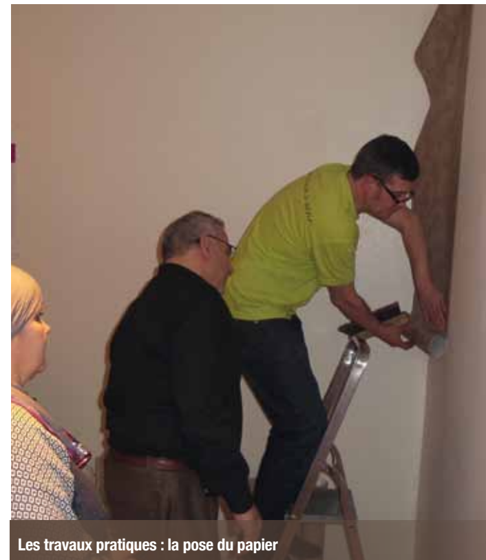
Les travaux pratiques : la pose du papier