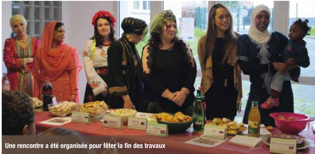
Une rencontre a été organisée pour fêter la fin des travaux

Valophis a rénové un foyer de France Terre d'Asile, à Créteil, début décembre. Les travaux se sont terminés par une réunion chaleureuse entre les ouvriers et les résidents.