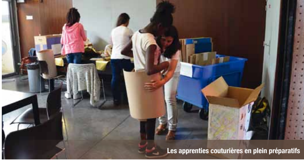
Les apprenties couturières en plein préparatifs