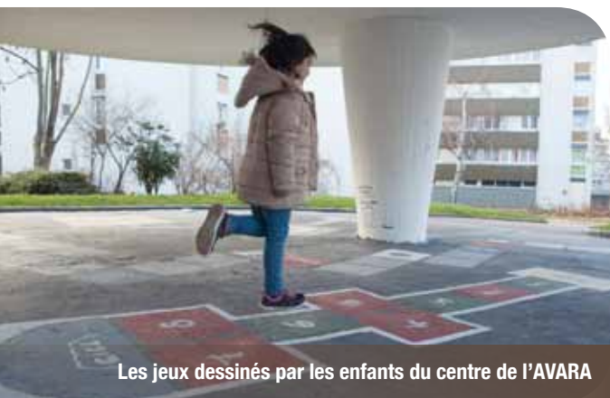
Les jeux dessinés par les enfants du centre de l'AVARA

« Abeilles Machine est un projet constructif qui a du sens et attire toutes les générations. Au départ, il a fallu rassurer les habitants, maintenant tout le monde est content car la démarche leur semble très sympathique. En plus, le miel, sans pesticide, est excellent ! »