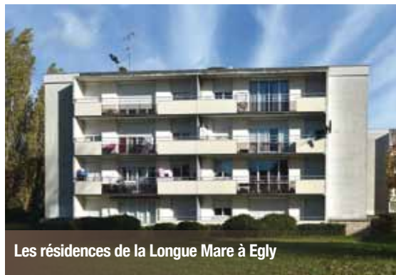
Les résidences de la Longue Mare à Egly