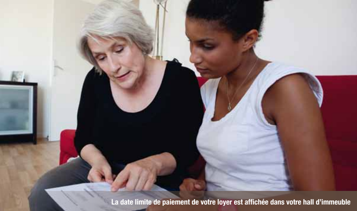
La date limite de paiement de votre loyer est affichée dans votre hall d'immeuble