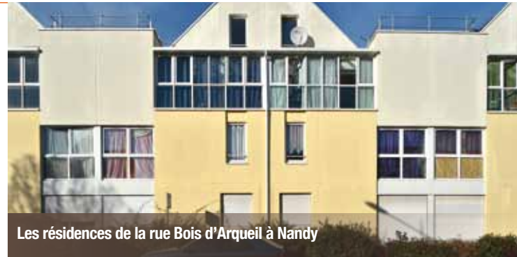
Les résidences de la rue Bois d'Arqueil à Nandy

Par ailleurs, Valophis La Chaumière de l'Ile-de-France a racheté deux résidences en Seine-et-Marne, l'une de 85 logements à Savigny-le-Temple et l'autre de 83 logements à Nandy. Valophis Sarepa a acquis 489 logements à Egly, dans l'Essonne.