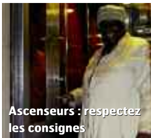
Ascenseurs : respectez les consignes

Dans tous les cas, ne tentez jamais d'ouvrir les portes avant que l'appareil ne se soit immobilisé et ne gênez ni leur ouverture, ni leur fermeture. ■