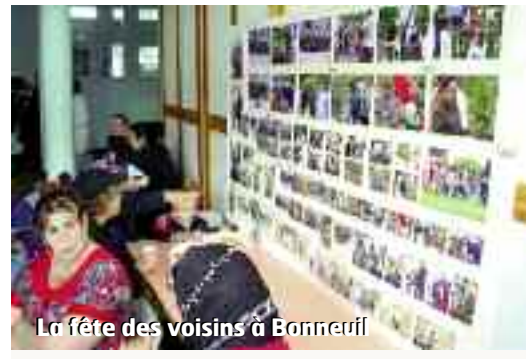
La fête des voisins à Bonneuil

Si vous souhaitez vous aussi participer à la vie de votre résidence, prenez contact avec votre