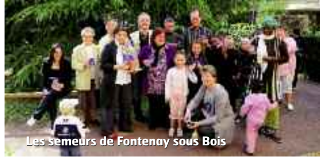
Les semeurs de Fontenay sous Bois

La suite dans le prochain numéro de Votre Résidence !