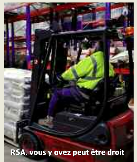
RSA, vous y avez peut être droit

Vous pouvez télécharger le formulaire en ligne ou vous adresser à votre Caisse d'Allocations Familiales (CAF), à votre Conseil général ou au Centre Communal d'Action Sociale (CCAS)