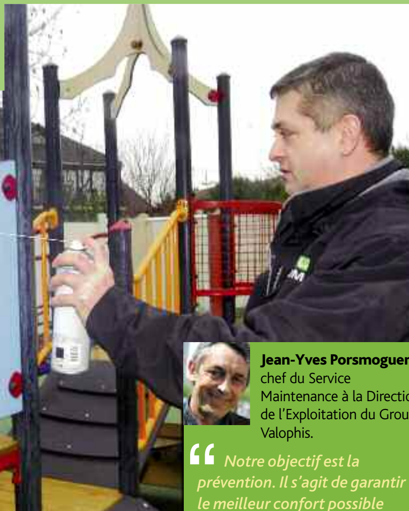
Nettoyage des tags

Traitement préventif et parfois curatif en cas de prolifération : deux fois par an. Coût moyen annuel : 11 € par logement.