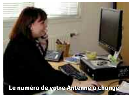
Le numéro de votre Antenne a changé

• Si votre numéro est connu (saisi dans la base), votre appel est directement dirigé vers votre Antenne. Vous êtes donc instantanément en contact avec le bon interlocuteur.