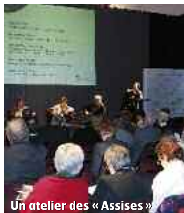
Un atelier des « Assises »

Le 19 mai, plus de 150 participants (représentants de locataires, élus et professionnels) ont débattu de l'avenir du logement social dans le Val de Marne.